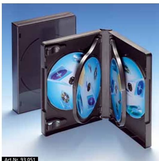
Art.Nr. 93 051