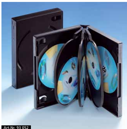
Art.Nr. 93 052