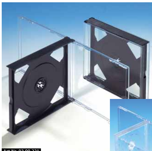
Art.Nr. 93 00 221