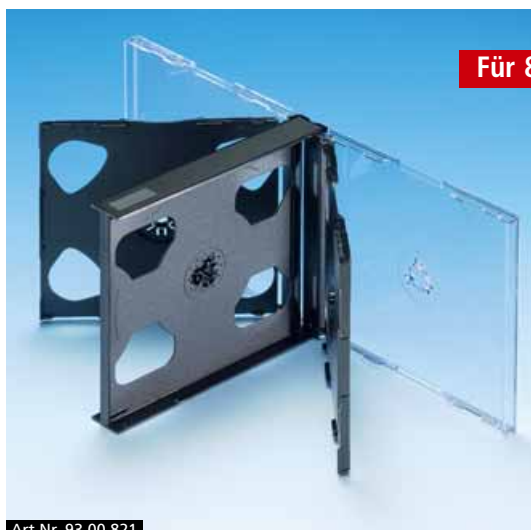
Art.Nr. 93 00 821