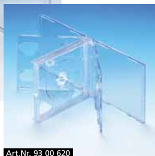
Art.Nr. 93 00 620