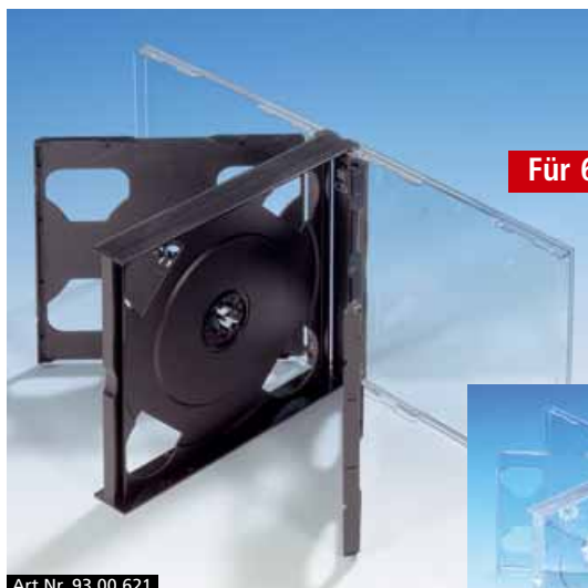
Art.Nr. 93 00 621