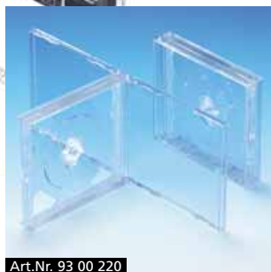
Art.Nr. 93 00 220