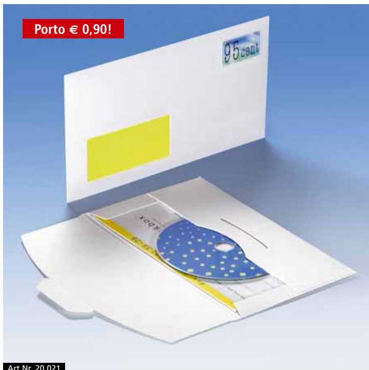
Art.Nr. 20 021