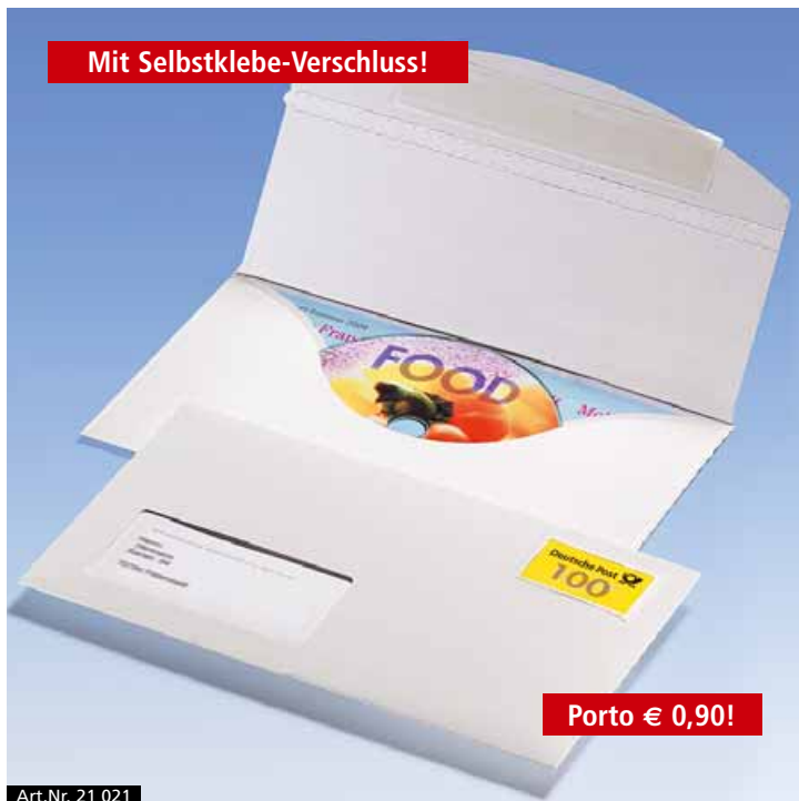
Art.Nr. 21 021

DiscMail CD-Briefhüllen bewähren sich seit über zehn Jahren und sind dadurch zu einem Synonym geworden für den porto-optimierten Postversand von CDs. Sicher geschützt und attraktiv verpackt sind CDs und DVDs damit natürlich auch. Kein Wunder, dass viele namhafte Firmen auch bedruckte Ausführungen von DiscMail Briefhüllen herstellen lassen. Fragen Sie uns bei Interesse an!