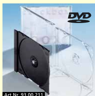
Art.Nr. 93 00 211