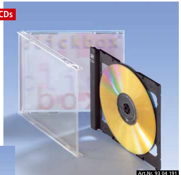
Art.Nr. 93 04 191