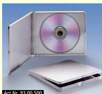
Art.Nr. 93 00 500