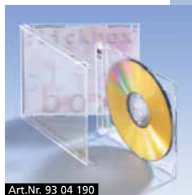
Art.Nr. 93 04 190