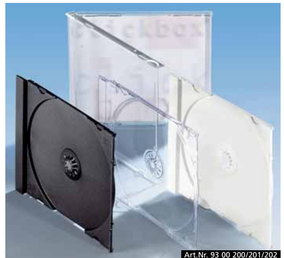
Art.Nr. 93 00 200/201/202