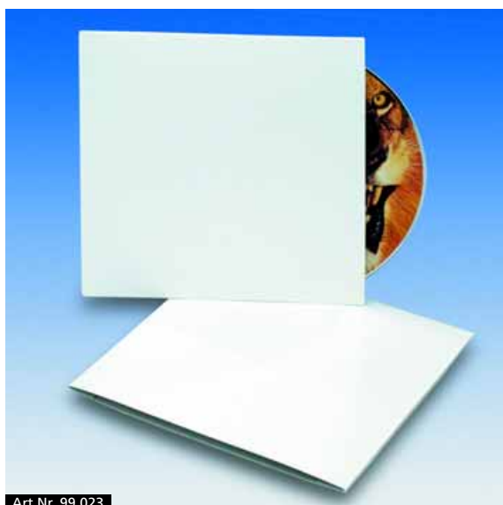
Art.Nr. 99 023