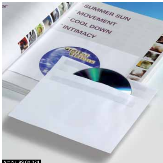
Art.Nr. 99 00 024