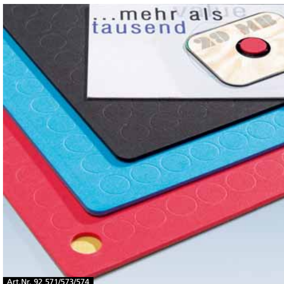
Art.Nr. 92 571/573/574