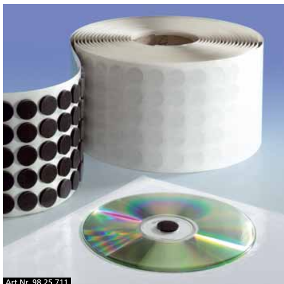
Art.Nr. 98 25 711