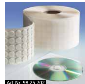
Art.Nr. 98 25 702