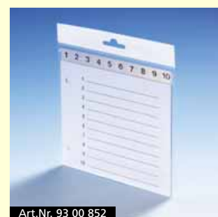
Art.Nr. 93 00 852