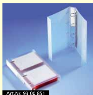
Art.Nr. 93 00 851