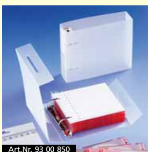
Art.Nr. 93 00 850